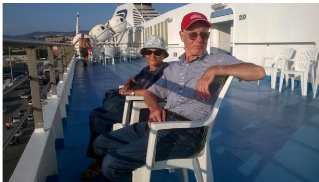
مازا كونچتا مگليو، لاهير د نوزارا دي سيسيليا فڊ 18 افريل 1936